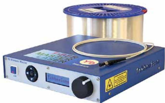
Рис.3. Опытный образец коммерческого сверхдлинного лазера компании "Техноскан – Лазерные системы"